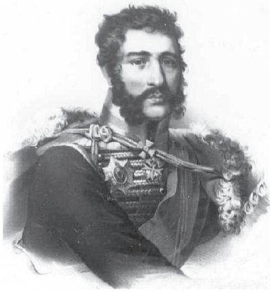
Яков Петрович Кульнев

Да не забудутся имена славных героев России, их деяния и подвиги во славу Отечества!