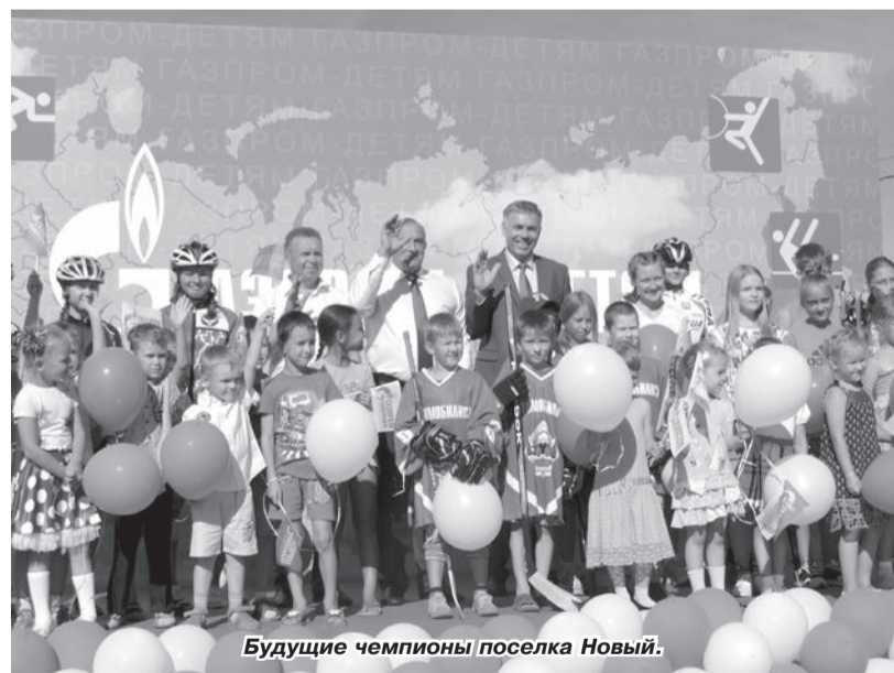
Будущие чемпионы посёлка Новый.

Контролировать ход строительства нового ФОКа будет филиал ООО «Газпром трансгаз Чайковский», расположенный на территории муниципального образования «Нововолковское», – Управление аварийно-восстановительных работ №1. Это предприятие образовано в 1993 году на базе АО «АТП «Волковское». Основными его задачами являются предотвращение и ликвидация аварий и аварийных ситуаций на линейной части магистральных газопроводов, восстановление разрушенных газопроводов, сварочно-монтажные работы при их капитальном ремонте, уча-