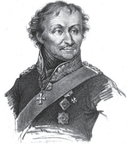
Матвей Иванович Платов

– Силы двенадцати языков Европы ворвались в Россию... Л.Н. Толстой, "Война и мир"